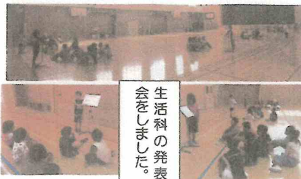
生活科の発表会をこまごまと

フィールドワークの代金は、バス代金と水族館入館料を合わせて一人2,100円として、すでに教材費と一緒に振り替えさせて頂いていますので集金はありません。差額は、教材費に繰り入れて、画用紙代等に充てさせて頂きます。なお、欠席した児童には返金があります。担任から連絡があります。